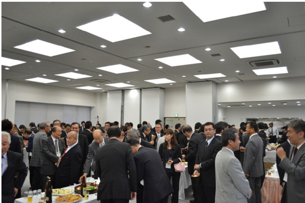
《「たまご研究会」 閉会の御挨拶》