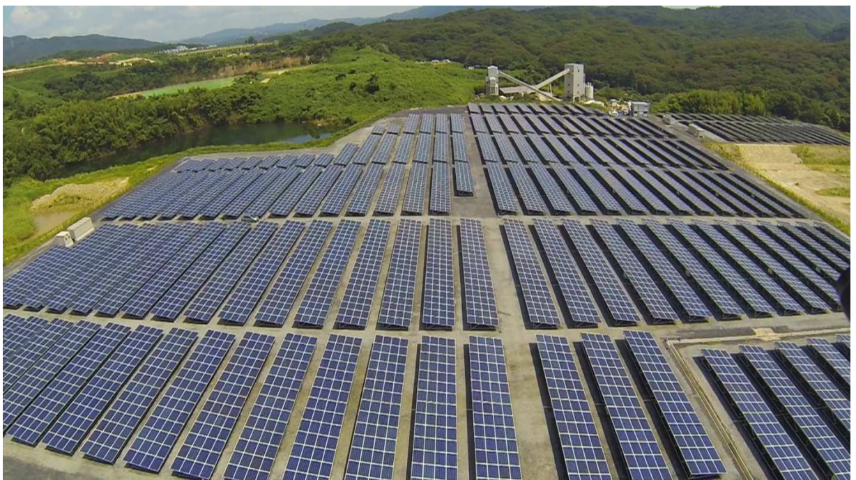
【京都グリーンソーラーファーム (京都府城陽市奈島下小路11-6他)】