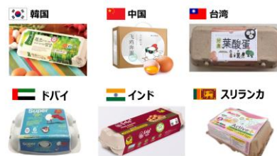
海外各国にも広がる「葉酸たまご」

葉酸の生理機能や妊娠期における重要性、日本における摂取状況の課題について解説しました。さらに、日常的に摂取しやすい食品である“たまご”に着目し、飼料設計により葉酸含有量を高めた「葉酸たまご」の開発背景や技術的工夫について説明しました。加えて、調理時でも葉酸が失われにくい特徴や、体内で利用されやすい性質について紹介するとともに、葉酸摂取の普及を目的とした取り組みとして「葉酸たまご甲子園」の活動を紹介し、食を通じた健康課題解決の可能性を提案しました。