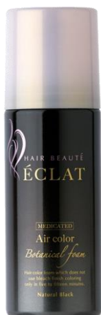
ボタニカル エアカラーフォーム

株式会社ファーマフーズ（本社：京都市西京区、代表取締役社長：金武祚）は、ヘアケア関連分野の研究開発に注力しております。この度、医薬部外品の白髪染毛剤「ヘアボーテ® エクラ ボタニカルエアカラーフォーム」の定期顧客件数が、2020年11月26日時点で10万件を突破いたしましたのでお知らせいたします。