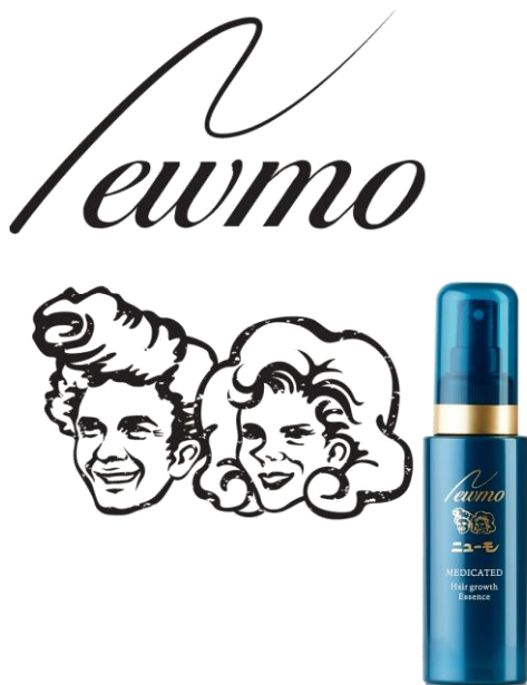
ニューモシリーズは京都から誕生

「ニューモ ® 育毛剤」に加えて、累計出荷数50万本 *2 を突破した「まつ毛★デラックス WMOA」や頭皮フローラを整える「Vactory シャンプー」も返礼品に採用されております。これにより、性別・年齢問わず返礼品をお選びいただけます。