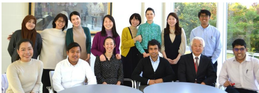
Global Solution Team

当社は、国籍、年齢、性別を問わず様々な人材が活躍しています。「宇宙人以外は誰でも応募歓迎」と考え、1年中新たな人材が入社してきます。特に近年はグローバル人材の採用に積極的に取り組んでおり、現在8カ国16名の